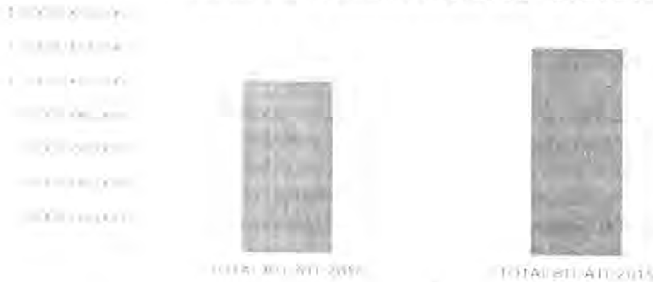
GRAFICA COMPARATIVA ATL - BTL 2015 - 2016

Que de lo anteriormente graficado se observa que en el año 2015 para esta contratación se tuvo una mayor apropiación presupuestal de la que se prevé para este año, demostrando así un ahorro del 25% en el presupuesto, dando cumplimiento a los parámetros establecidos en el Plan de Austeridad del Gasto 2016.