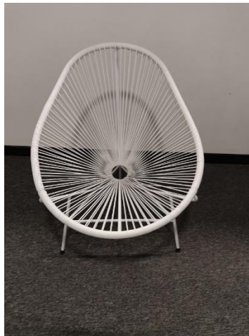
MESA DE REUNIONES REDONDA