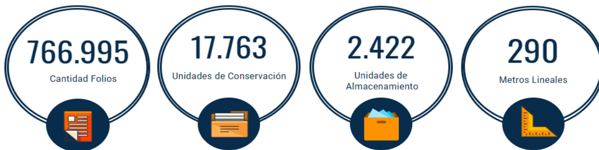
Imagen N° 02. Caracterización Documentación Física Fondo Documental CEV

Toda la información física procesada se encuentra resumida de la siguiente manera: